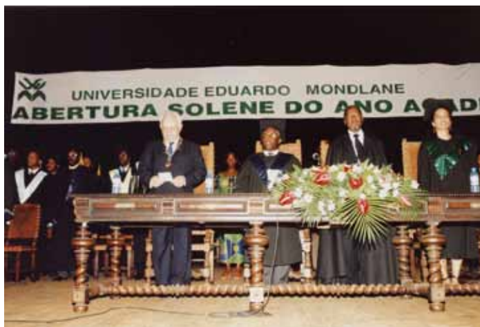
Abertura solene do ano académico 2002, na Universidade Eduardo Mondlane.

O curso de Verão, que a Universidade de Coimbra