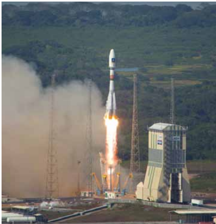
Fig. 1 - Lançamento do foguetão Soyuz na Guiana Francesa (5° a norte do equador). (ESA)

Em 2006, a Agência Espacial Europeia (ESA) assinou com a Federação Russa um contrato para o lançamento a partir da Guiana Francesa (5° N) de foguetões Soyuz. O primeiro lançamento ocorreu em outubro de 2011, permitindo à Soyuz colocar em órbita quase o dobro da carga anteriormente transportada e permitindo poupar 140 milhões de euros por lançamento. Neste exemplo, o lançamento para uma órbita