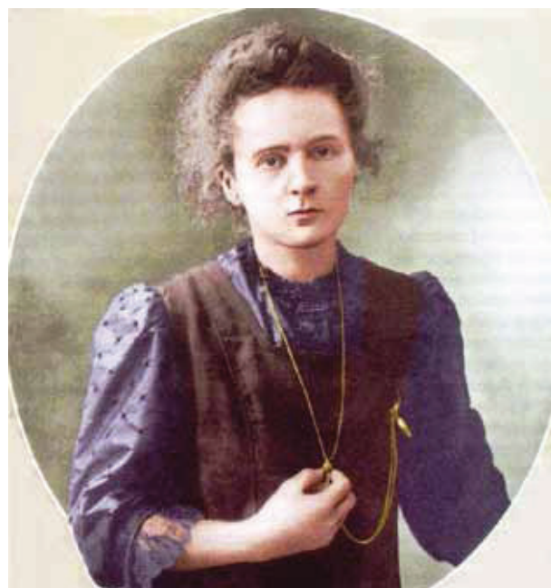
Fig. 1 - Marie Curie com 44 anos, fotografada no ano de atribuição do Prémio Nobel da Química.

A data de nascimento de Marie Curie, 7 de Novembro, foi agora escolhida para a celebração do Dia Internacional da Física Médica. Não poderia ser mais apropriado. Ainda recentemente se celebrou o centenário do Prémio Nobel de Química atribuído em 1911 a Marie Curie, uma efeméride