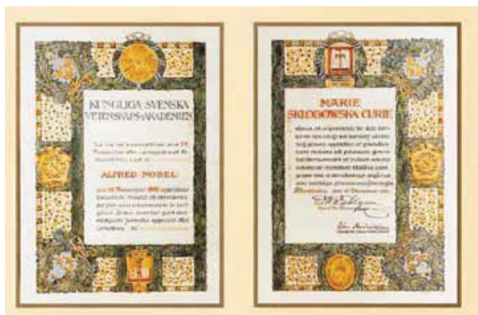
Fig. 4 - Diploma do Prémio Nobel da Química atribuído a Marie Curie, 1911.

Os resultados desta pesquisa extraordinária evidenciam a tenacidade dos Curie no trabalho de investigação científica, a clareza do raciocínio ao formularem as hipóteses de trabalho, o procedimento experimental seguindo com rigor o método científico e aceitando com abertura de espírito e curiosidade reforçada os resultados que não confirmavam as hipóteses que pretendiam demonstrar. Aliás, Marie Curie conquistou desde cedo o respeito dos seus colegas de La Sorbonne e do meio científico francês, sendo reputada pela precisão das suas medições de radioactividade. Nesta mesma linha iniciou um trabalho de preparação de fontes padrão de radioactividade, baseadas no urânio metálico, e que