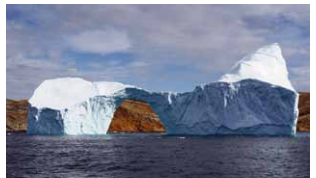
Fig. 4 - Icebergue na Gronelândia.

Da observação do modo como se formam e derretem os icebergues no Ártico e no Antártico os cientistas concluem que a Terra está a aquecer (fig. 4). As consequências de um aquecimento global podem ser muitos graves para a vida na Terra. Todos temos de actuar e impedir que o aquecimento seja devido ao modo como vivemos!