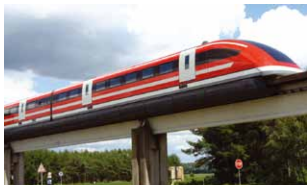
Fig. 1 - Comboio Transrapid 09, um maglev alemão, que se desloca com a utilização de magnetes supercondutores.

Já reparaste que a água pode aparecer de várias formas? Podemos vê-la como água líquida ou como gelo, e sabemos que, apesar de invisível, está presente no ar na forma de vapor de água. Dizemos que a água pode existir em diferentes estados ou diferentes fases. Para passar de um estado para outro basta alterar a temperatura. As formas que a matéria pode adquirir variando a temperatura têm sido estudadas pelos físicos. Já ouviste falar dos comboios Maglev (fig. 1), comboios que levitam e se deslocam por ação de forças magnéticas? Conseguem mover-se a velocidades muito altas graças à utilização de magnetes num estado a que chamamos supercondutor, que se consegue obter a temperaturas muito baixas. Já o grande acelerador de partículas no CERN foi preparado para criar outro tipo de matéria muito especial, o plasma de quarks e glúões (fig. 2). Esta matéria poderá existir no interior de algumas estrelas. Neste caso