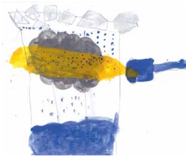
Fig. 3 - Nuvem num frasco de vidro

Observa o que acontece. Conseguiste criar uma nuvem? E chuva? O teu medidor de chuva indica que choveu?