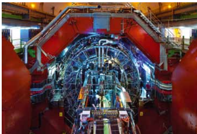
Fig. 2 - Detetor ALICE no Large Hadron Collider do CERN utilizado para estudar as propriedades do plasma de quarks e glúões.

precisamos de atingir temperaturas ou densidades extremamente altas. Mas essas são outras histórias. Hoje vamos falar das fases da água.