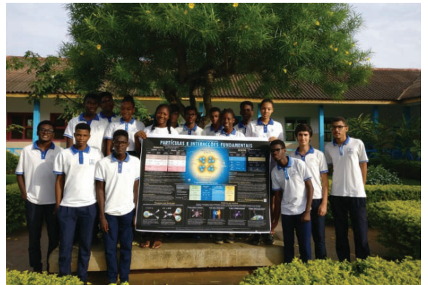
Fotografia tirada por André Freitas dos seus alunos na Escola Portuguesa de São Tomé e Príncipe com o poster do Modelo Padrão da Física de Partículas, na sequência de uma palestra virtual de Pedro Abreu, em 2017.

Ficam-nos as boas memórias das atividades realizadas, das conversas sobre Física e Física de Partículas, dos momentos no CERN e nas sessões remotas, nos almoços partilhados. Mas