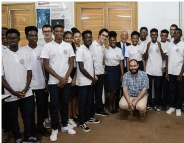
O Relatório da SPF, sobre o impacto divulgativo e formativo desta instalação, foi decerto um passo importante para a aprovação do projeto que apresentámos depois à EPS no domínio da sismica.