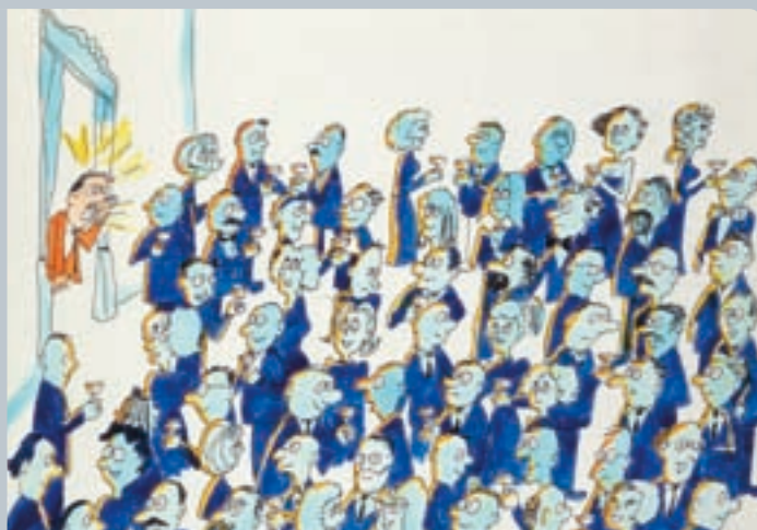
...Se um rumor atravessa a sala,