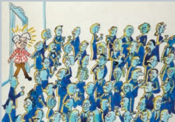
...Entra na sala um cientista de grande renome, uma verdadeira estrela, e à medida que atravessa a sala cria, naturalmente, a cada passo, uma aglomeração de admiradores, ansiosos por falarem com ele.