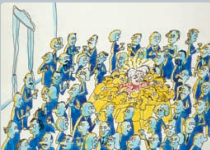
...Isto impede-o de percorrer a sala normalmente, criando-lhe uma resistência ao movimento, como se a sua massa aumentasse, tal como acontece a uma partícula que se move através de um campo de Higgs