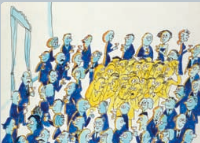
... também produz um efeito de aglomeração, mas desta vez entre os próprios cientistas na sala. Estes aglomerados são como as próprias partículas Higgs.

Em geral, um campo em Física tem uma partícula associada. Por exemplo o campo electromagnético tem associado a partícula (de luz, visível ou invisível) a que chamamos fóton. Também deverá haver uma partícula (bóson Higgs) associada ao campo de Higgs. Descobrir esta partícula permitirá decidir sobre a hipótese da origem de massa das partículas no universo residir na interacção dessas partículas com o campo de Higgs. Este pode permeiar o espaço onde as partículas se movem. Assim, tal como acontece macroscopicamente, quando um objecto dentro de um líquido sente forças de viscosidade e tem mais dificuldade em deslocar-se, o campo de Higgs pode gerar a massa das partículas que viajam nesse espaço. Compreender a massa das coisas à nossa volta permite finalmente entender a estrutura e tamanho das mesmas: se a massa do electrão fosse mais pequena, por exemplo, átomos, moléculas, tudo, de um grão de poeira à maior galáxia, passando pelo sistema solar e por nós mesmos, seria tudo muito mais pequeno. E sem massa o universo não poderia mesmo organizar-se, consistindo num enxame confuso de partículas zigzagueando velozmente à velocidade da luz.