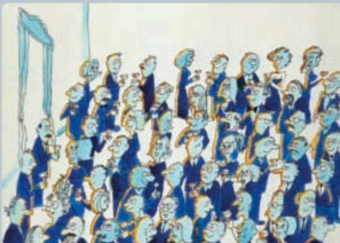
Imagine-se uma sala cheia de cientistas, conversando calmamente uns com os outros. Esta sala é como um espaço cheio com campos de partículas Higgs.