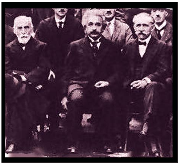
Lorentz, Einstein e Langevin em 1927

É na década de trinta que os físicos aparecerão de uma forma mais determinada no palco desta representação. É preciso aguardar pelos finais de 1929 para que o país receba a visita de um físico ilustre e pioneiro no debate em torno das ideias relativistas, Paul Langevin. Esta visita e o início da chegada de alguns físicos, bolseiros da Junta de Educação Nacional em países europeus, constituirão o estímulo para que o tema Relatividade comece, lenta e esporadicamente, a ser incluído no ensino da Física, já que, tanto quanto saibamos, na época, nunca foi alvo de qualquer tentativa de investigação por parte dos físicos portugueses.