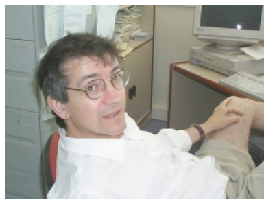
Paulo Carra, o físico italiano premiado.