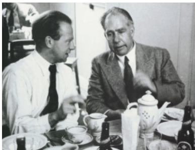
Werner Heisenberg e Niels Bohr.

As apresentações mais interessantes no simpósio foram efectuadas por Hans Bethe e John Wheeler, físicos eminentes que trabalharam no projecto de bomba dos aliados e que conheceram Bohr e